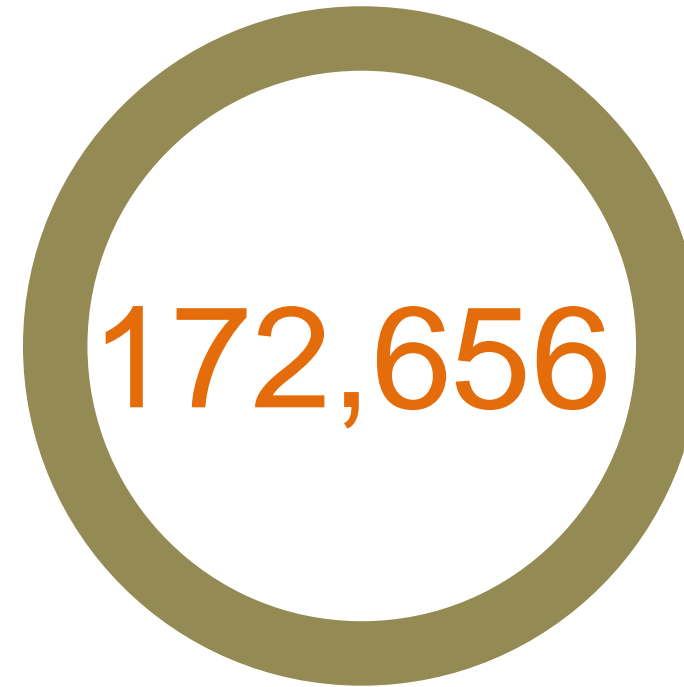
ACCIONES RELACIONADAS CON EL CUMPLIMIENTO LABORAL ARCL