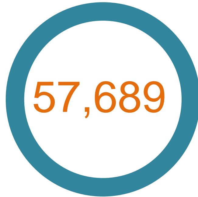
ESPACIOS ACADEMICOS MONITOREADOS